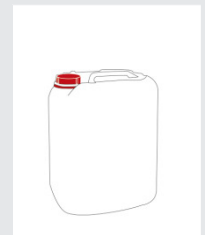
Kanister 25 kg Art.-Nr.: 2000568