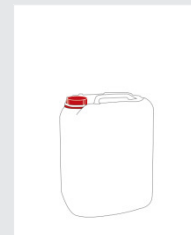
Kanister 5 l Art.-Nr.: 2000770